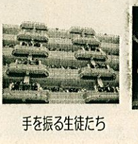
手を振る生徒たち