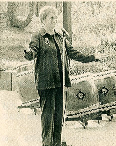
メアリー・アシュレー議員(Fromキャンベル)↓