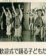
歓迎式で踊る子どもたち