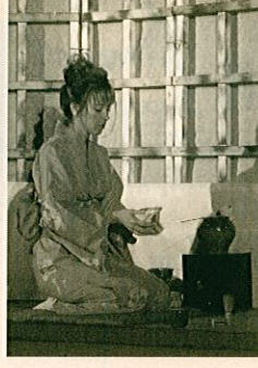
きものもゆかたも自分たちで着れるんです!