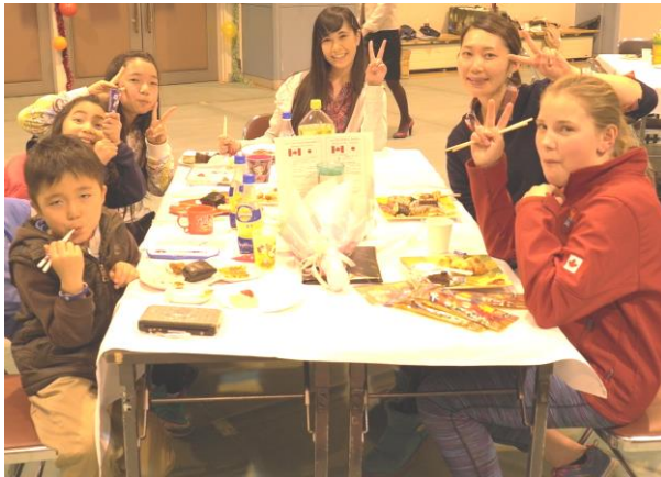
▲さよならパーティ