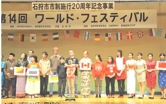
▲オープニング・国紹介