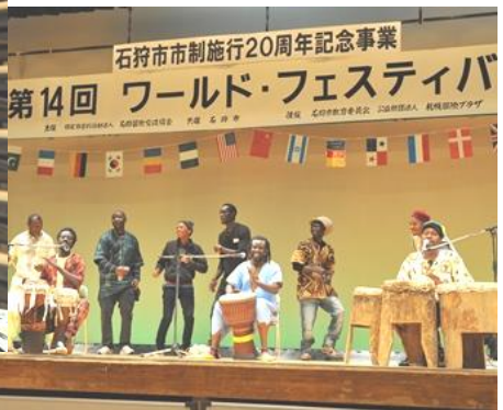
▲アフリカ・ドラム&ダンス