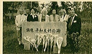
▲鎮魂の碑と訪問団