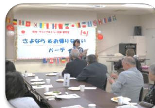
高校生交換留学事業