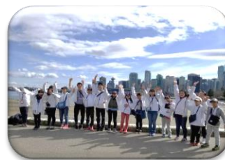
少年少女親善訪問団