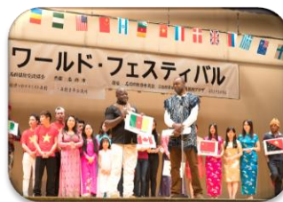
国際交流イベント