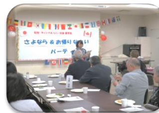
高校生交換留学事業