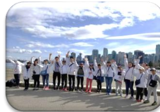
少年少女親善訪問団