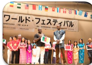
国際交流イベント