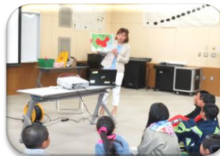
出前講座・日本語教室