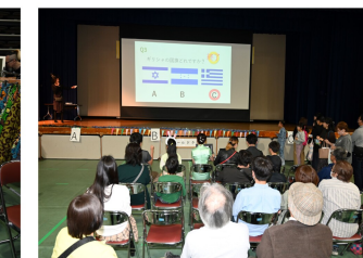
来場者&スタッフ全員参加型ワールドクイズの様子