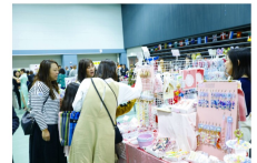
ハンドメイド雑貨 「ドルavenue 1丁目」