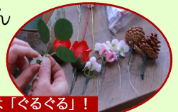
合言葉は「ぐるぐる」!

やさしい日本語、英語、中国語が飛び交う中、「ぐるぐる」という掛け声と共に、全ての材料を1つずつ針金で巻き、土台となるオアシスに花々を挿していきます。年末年始に向けた、オリジナル作品が仕上がりました。外国人の皆さんも新しい日本語「ぐるぐる」を覚えました！