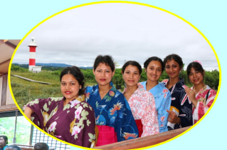
気分はモデルさん♪