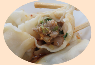
好吃！美味の水餃子 「水餃子は美味しいね！」