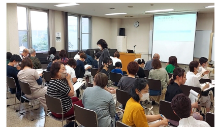
2023/6/15 (木) 養成講座2回目の様子。 やさしい日本語を意識してペアワークをしました。