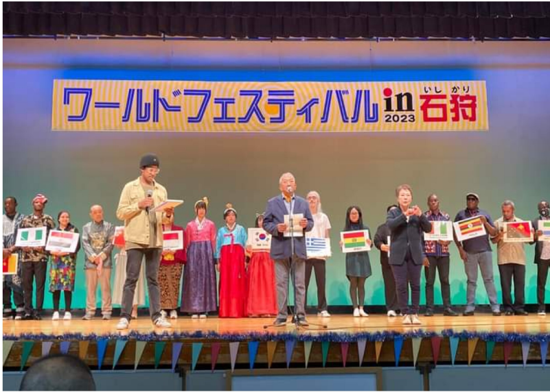
オープニングの様子。日英2か国語と手話通訳による開会挨拶。