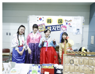
韓国ブース。ステージ発表ではK-POPダンスを披露しました！