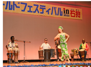
アフリカのリズムに乗って…♪ キカンラによるパフォーマンス