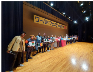
オープニング前の舞台裏。国旗カードを持ってスタンバイ☆