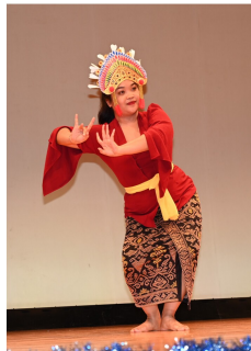
インドネシア・バリ舞踊