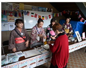
受付の様子。着物&浴衣を着て来場者を華やかに迎えました