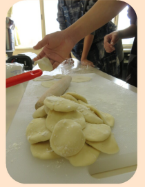
講師の説明をしっかりと聞き、仲間と協力し合いながら手際よく水餃子を作りました。