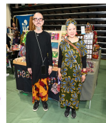
アフリカ布雑貨 「peace sign」