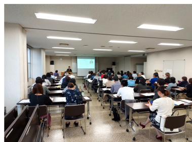
2023/6/8 (木) 養成講座1回目の様子。テキストを使い、コミュニケーションの基礎を学びました。