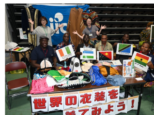
JICAブース。今年も多数の研修員が参加しました！