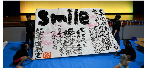
子ども達による書道パフォーマンス