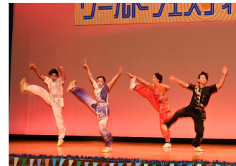
北海道中国武術倶楽部の皆さんによるダイナミックな武術演武