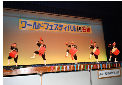
琉球國祭り太鼓の皆さんによるエイサー(初出演)