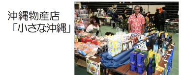
沖繩物産店 「小さな沖縄」