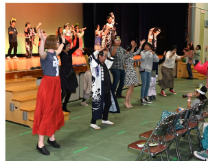
皆で踊ろう！石狩しゃけサンバ 石狩流星海の皆さんと共に