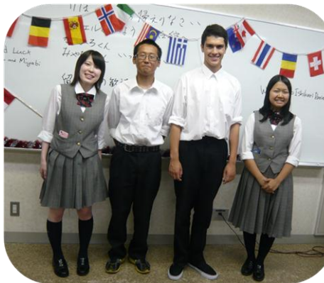
▶留学生紹介(左から)