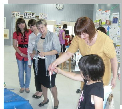
▶子ども未来館あいぼーとにて