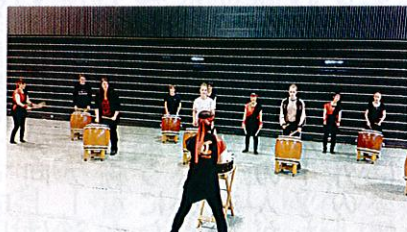
和太鼓を初体験! 上手に演奏できたかな?