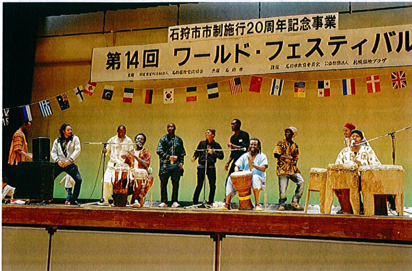
昨年の様子。アフリカチームによるドラム演奏&ダンス

毎年、秋に行われる当協会主催のイベントです。多くのボランティアの皆様に支えていただき、今年で15回目を迎えることができました。誠にありがとうございます。節目の年ということで、今回もご来場の皆様にお楽しみいただける内容を企画してまいりますので、どうぞお楽しみに！