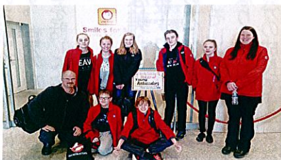
焼きそば弁当が出来るまでを 見学しました(東洋水産)