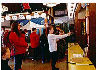
登別伊達時代村 弓矢と手裏剣に夢中!