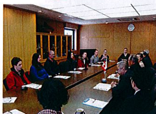
市役所を訪問しました