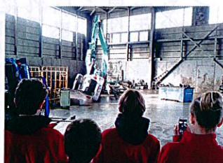
自動車解体作業を見学中 (マテック)