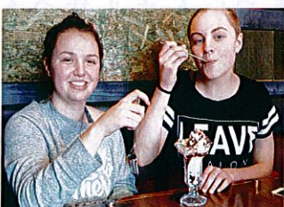
チョコパフェ大好きっ