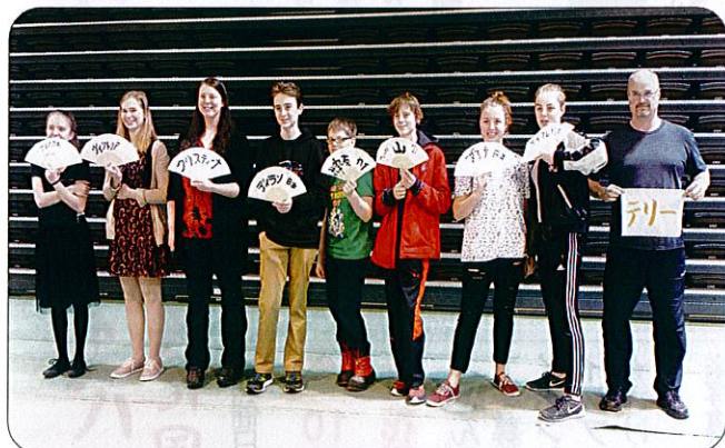
5日目の書道体験でのワンショット。 みんな並んで「ハイ、チーズ!」 とても上手に書きました。